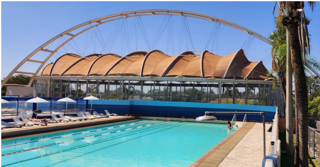
FOTO: Piscina coberta sem uso e sem manutenção, interditada ao uso do associado.