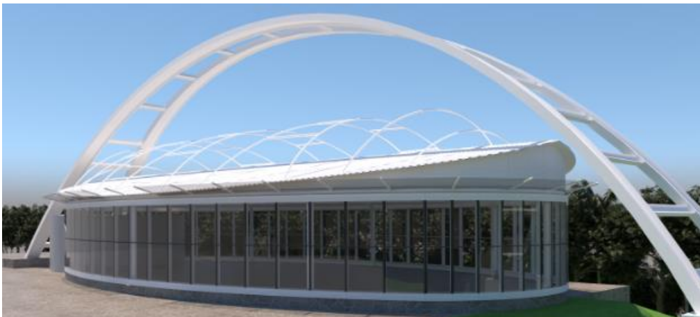
IMAGEM DIGITAL ORIENTATIVA: Piscina Coberta com Cobertura Metálica, após reforma proposta.

A Piscina Coberta será devolvida ao associado com toda segurança e funcionalidade, para que possa aproveitar deste importante patrimônio, que tanta falta tem feito.